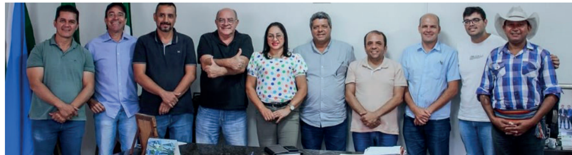
Prefeito Réus e vereadores eleitos nas eleições de 2024

Réus Fornari: Sempre busquei manter um relacionamento de respeito e diálogo com a Câmara Municipal e com os demais poderes. Entendo que, quando cada um cumpre bem seu papel, quem ganha é a população. A Câmara tem sido parceira em muitas pautas importantes para o desenvolvimento de Rio Verde, e essa união entre os poderes é essencial para que as políticas públicas avancem com responsabilidade