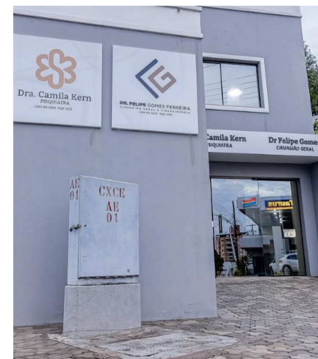
Prédio onde são realizados os atendimentos

parabenizar ao jornal Diário do estado pela iniciativa em falar sobre adoecimento mental, ajudando a reduzir o estigma e o sofrimento das pessoas que lidam com esta dor. Também quero agradecer ao espaço que me foi oferecido e dizer que estou muito satisfeita em trazer esses esclarecimentos a população coximense. (Glenda Melo - Diário do Estado)